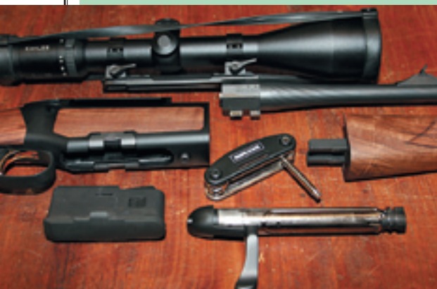
Demontáž tejto zbrane zvládne každý a veľmi rýchlo. To je jej silná stránka.