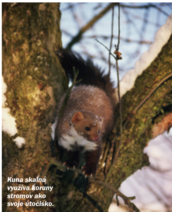
Kuna skalná využíva koruny stromov ako svoje útočisko.

Tieto šelmičky sú mäsožravé živočíchy. Lovenie koristi teda nemá nič spoločné s túžbou po zabíjaní.