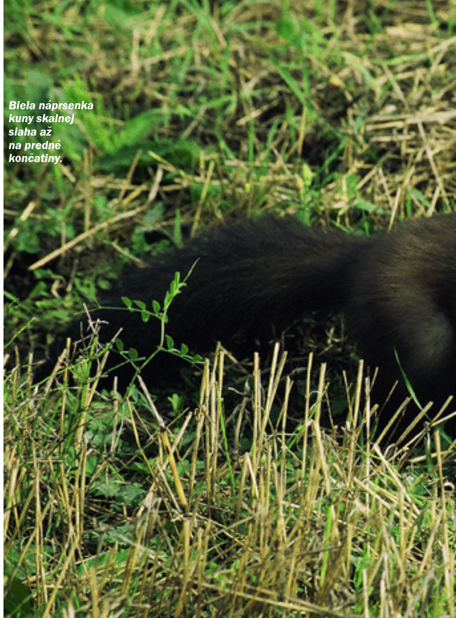
Biela náprsenka kundy skalnej siaha až na predné končatiny.