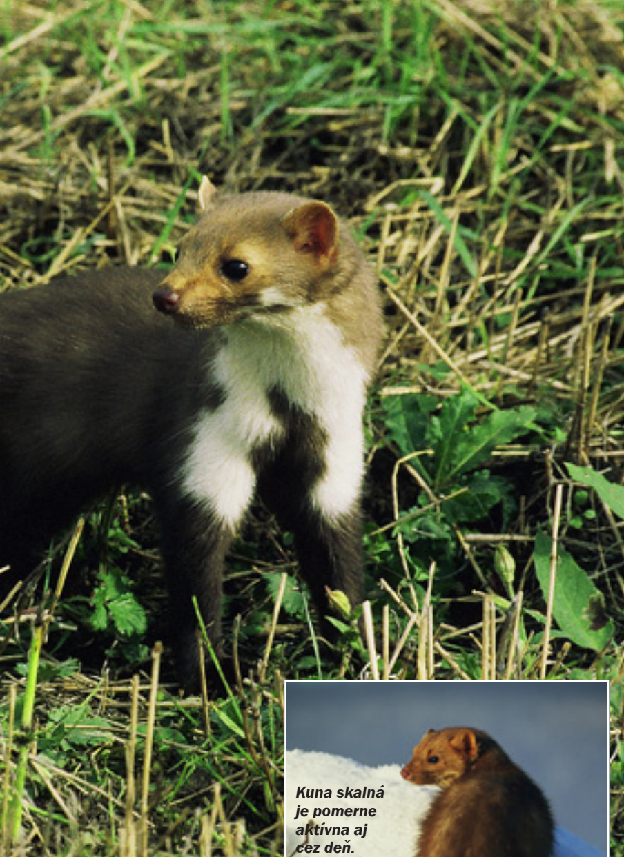
Kuna skalná je pomerne aktívna aj cez deň.