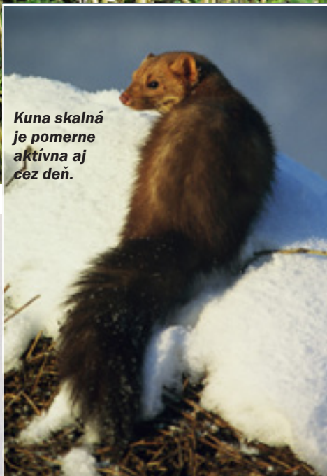
Kuna skalná vyhľadáva úkryty v okolí ľudských príbytkov.

dlhší a huňatejší chvost, konček nosa je čierny. Na labkách medzi bruškami prstov jej vyrastá dlhá sršť. K lovu domácich zvierat sa dostane len občas, na druhej strane je postrachom veveričiek a ohrozuje vtáčie hniezda. Koristi sa zmocňuje skokom. Menšie úlovky požíra na mieste, väčšie si odtiahne do úkrytu.