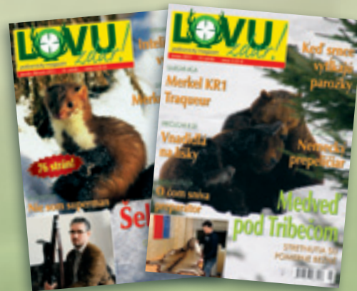
LOVU ZDAR! vychádza 10-krát ročne

Máj - jún druhý rok veku tretie parožie - ihličiak, vidliak, šestorák