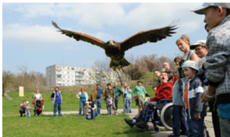
Veľkou atrakciou pre deti bolo vystúpenie sokoliarov.