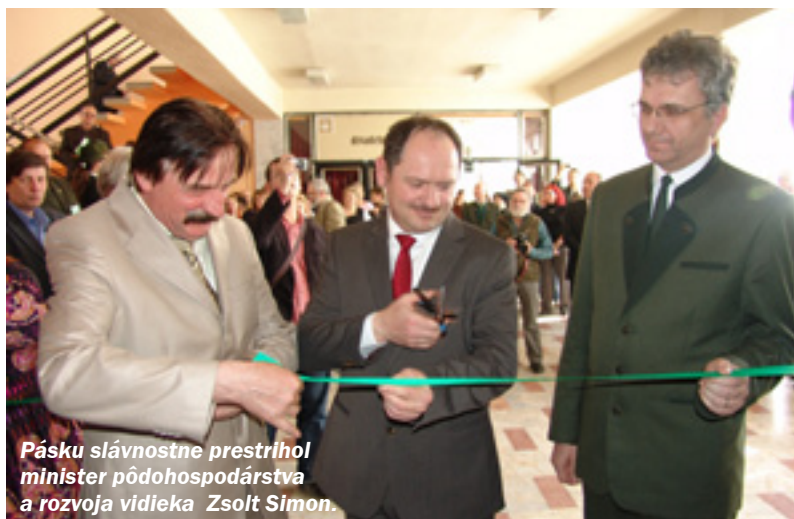
Pásku slávnostne prestrihol minister pôdohospodárstva a rozvoja vidieka Zsolt Simon.