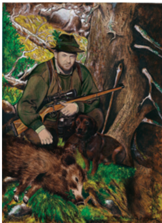
O jej diela prejavujú záujem aj poľovníci.

ších plochách uhlíkmi. Farebné sa tvoria špeciálnymi farebnými tužkami, suchým pastelom, kriedou, akvarelovými, akrylovými alebo olejovými farbami. Každý portrét je vytvorený kombináciou týchto materiálov a rôznymi postupmi a technikami, ktoré som rokmi zdokonaľovala. Grafitová ceruza je mi najbližšia, práve ona umožňuje vytvoriť prepracovaný detail. Po-