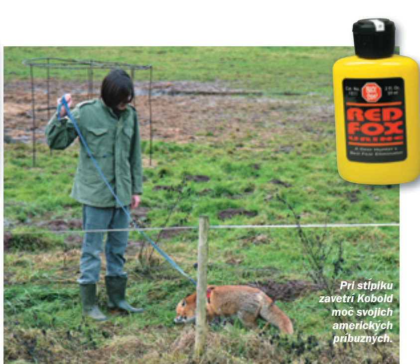
Pri stípiku zavetrí Kobold moč svojich amerických príbuzných.

tom prejdete s lišiakom na vodidle, pričom treba dať pozor, aby mal možnosť prípravky zavetriť.“ Lúka je mokrá a blatistá. Otváram žltú fľaštičku s produktom Red Fox Urine . Fúj, riadne zapácha. Nakvapkám z neho trochu na kôl ohrady a idem ďalej. Ďalšiu páchnucu bombu zanechávam 50 metrov odtiaľ. Do desiatich minút mám všetky vzorky rozmiestnené.