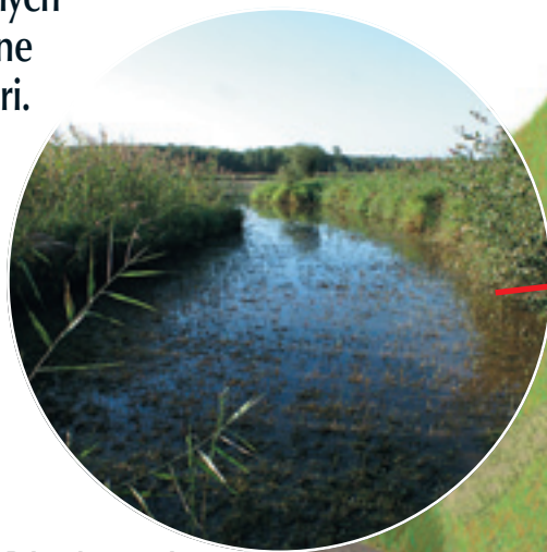
Prieseky v trstine obzvlášť oceňuje vtáctvo, ktorému slúžia ako úkryt pred studeným zimným vetrom.