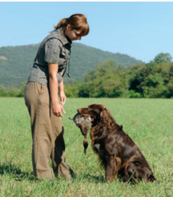
Pri správnom výcviku získate spoľahlivého pomocníka.

vždy stáť za svojim a psíkovi hneď od začiatku zakazovať veci, ktoré budú nežiaduce aj vo vyššom veku. Okrem toho treba mať na pamäti, že aj pes je živý tvor a má svoje nálady. Preto nie je vhodné výcvik preháňať. Hlavne pri aporte sa mi osvedčilo vracat' sa k tréningu každé dva dni. Psík si od „nátlaku“ trochu odpočinie a potom robí s oveľa väčšou radosťou, ako keď ho trápime každý deň. Ďalšia vec, na ktorú si treba dať pozor, je samotné cvičenie hľadania v poli. Keď si raz pes zvykne pohybovať sa ďaleko od strelca, je veľmi ťažké naučiť ho pracovať pod flintou,“ upozorňuje chovateľka.