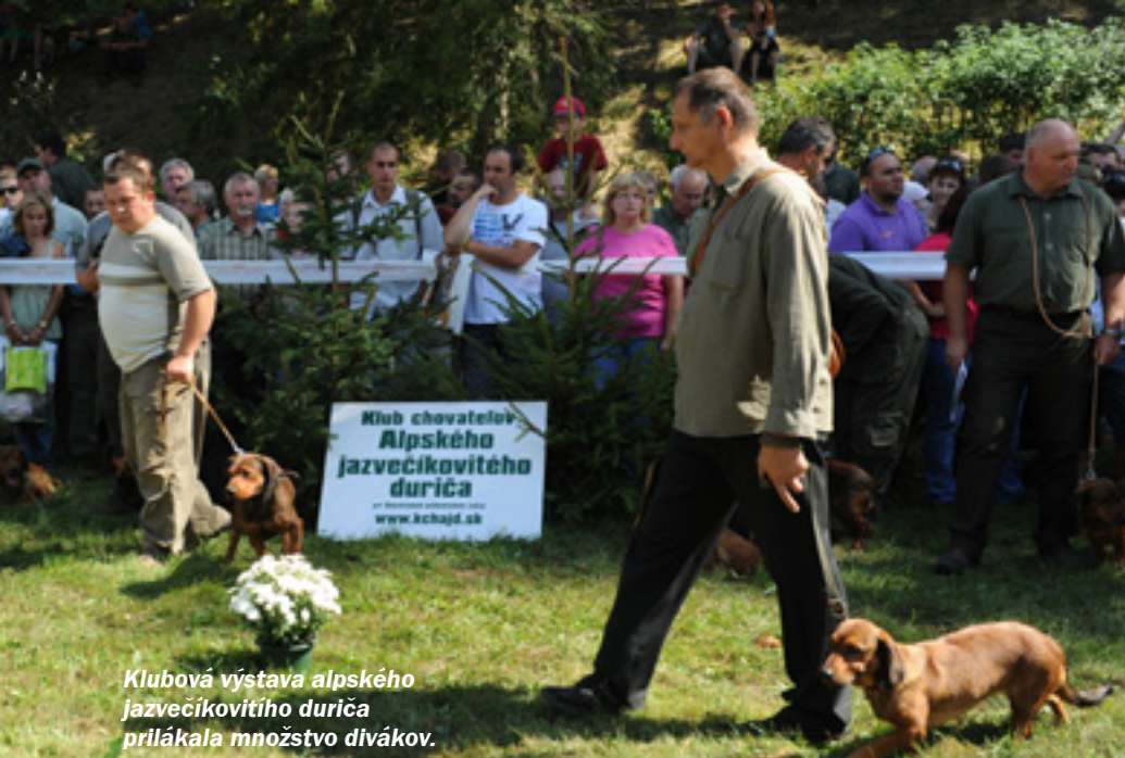
Klubová výstava alpského jazvečíkovitého duriča prilákala množstvo divákov.