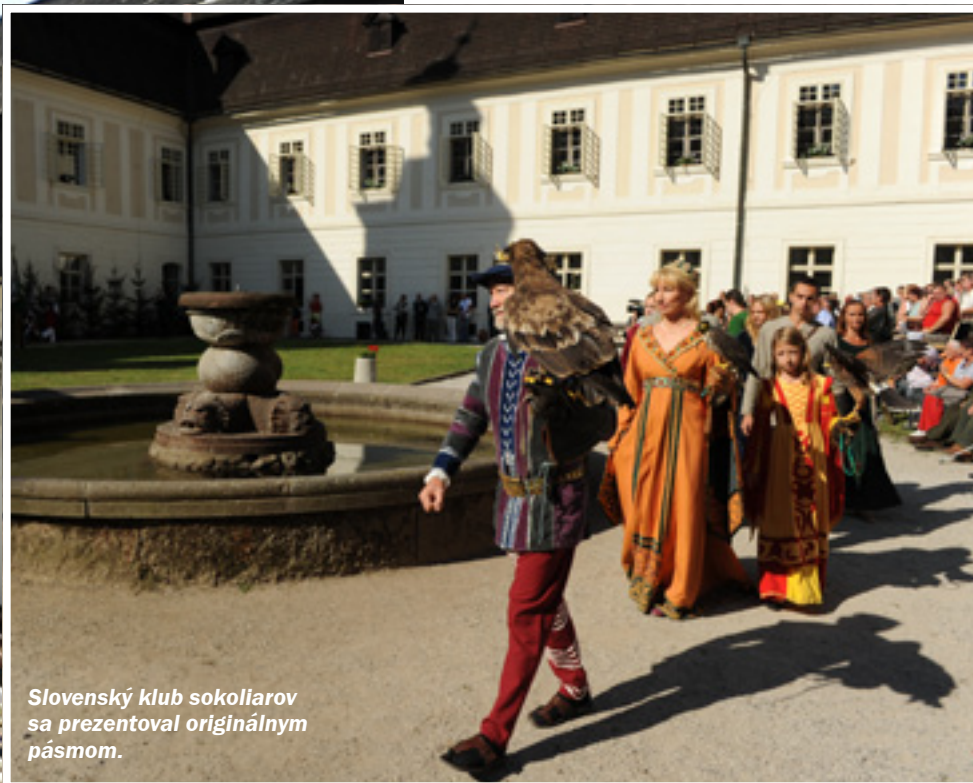
Slovenský klub sokoliarov sa prezentoval originálnym pásmom.