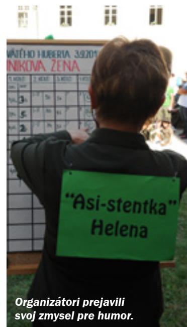
Organizátori prejavili svoj zmysel pre humor.