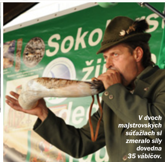
V dvoch majstrovských súťažiach si zmeralo sily dovedna 35 vábičov.

to rok dočkali významnej pocty – uvedenia do Siene úcty a slávy slovenského poľovníctva.