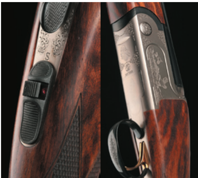
Pohľad zblízka na volič streľby a na hlavu psa naspodku baskuly.

Pokladali sme si za povinnosť poskytnúť vám takýto základný prehľad, i keď nie je možné detailne rozobrať všetky štyri zbrane. Na testovanie sme si zvolili prvé dve spomenuté – Labrador a Setter, čiže jeden oceľový model