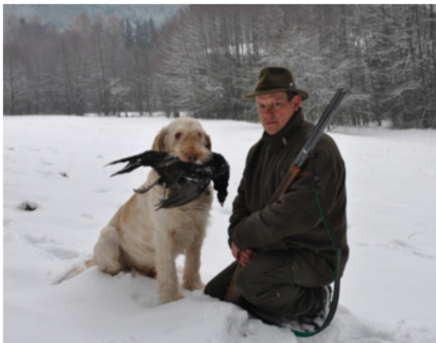
Hustá srst je v zime výhodou.

Napriek svojej veľkosti spinone nie je strážne plemeno, ale keď sa mu za plotom niečo