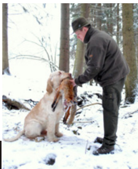
Tomáš sa snaží podporovať všetky lovecké danosti psa.

Text: Marianna Rajska