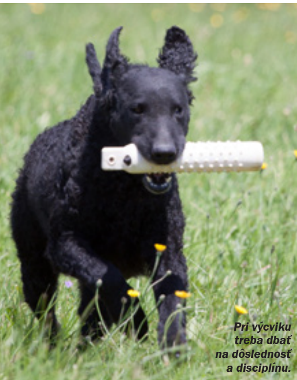
Pri výcviku treba dbať na dôslednosť a disciplínu.

lepšie spoznávala. Ako hovorí, získalo si ju svojou typickou povahou.