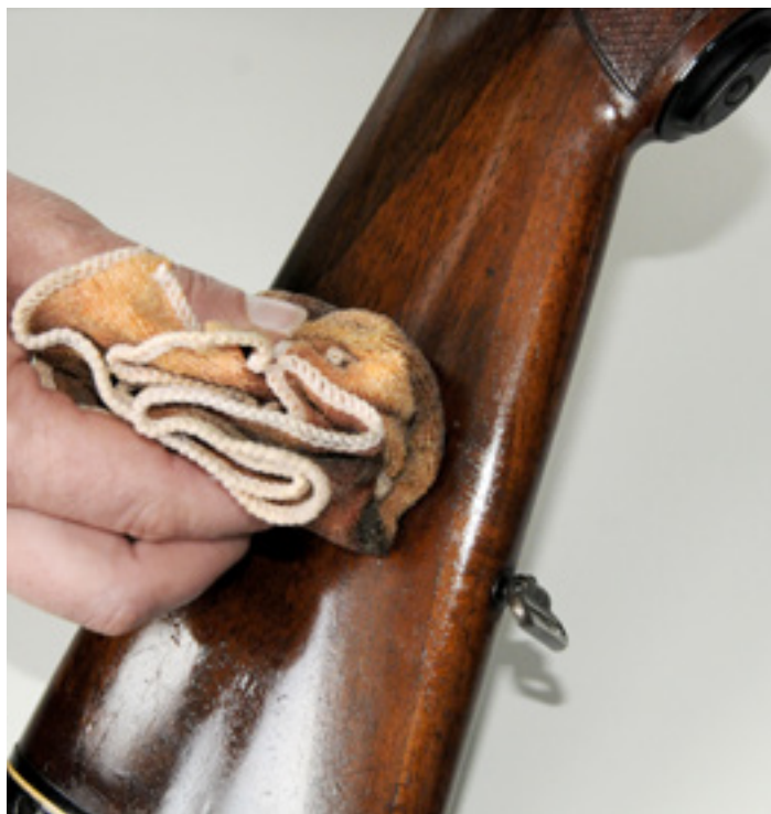
Krok 4: posledné olejovanie