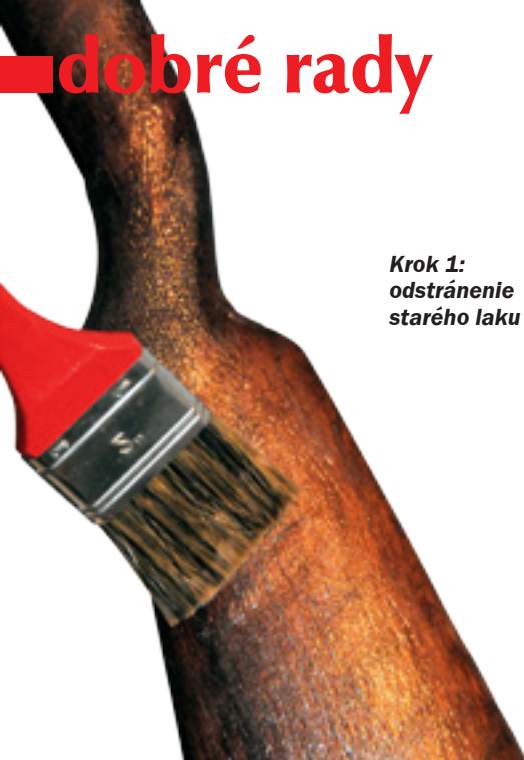
Krok 1: odstránenie starého laku