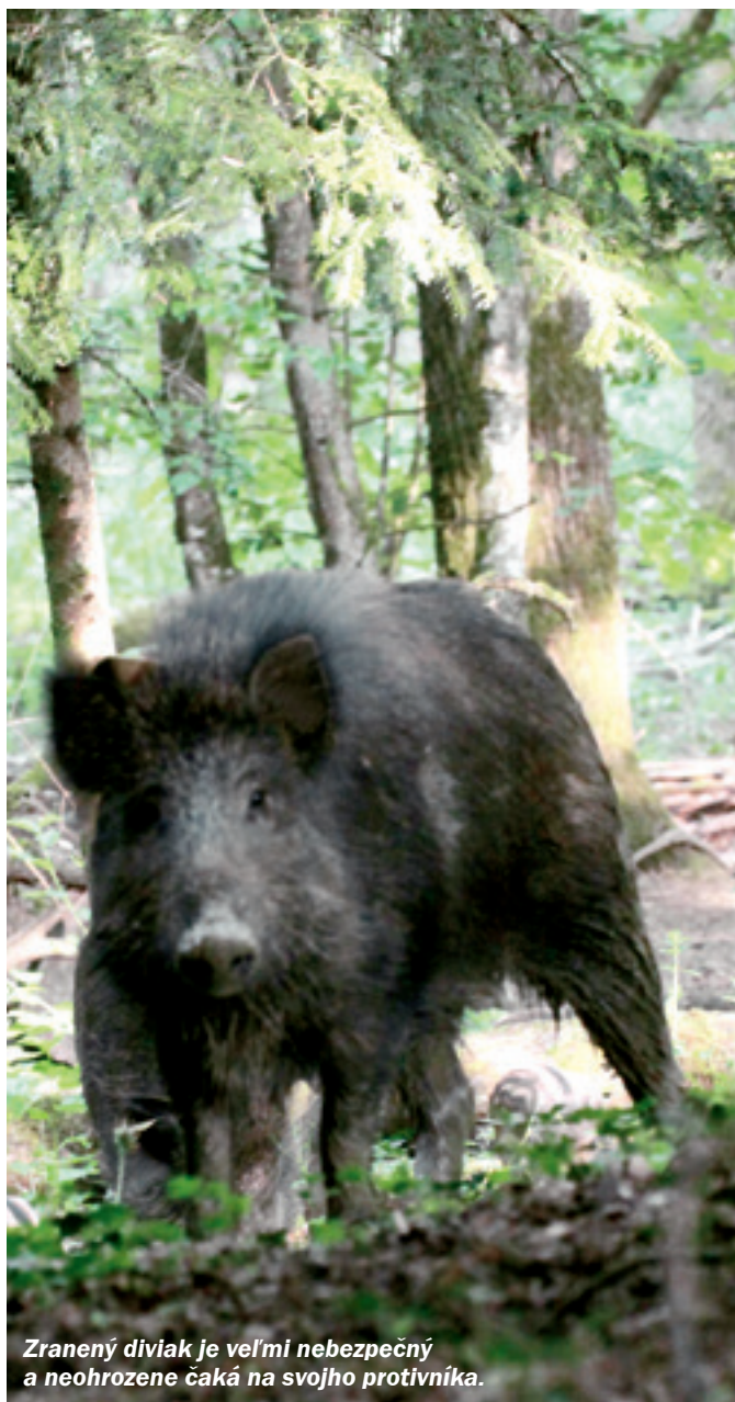
Zranený diviak je veľmi nebezpečný a neohrozene čaká na svojho protivníka.

riekla nad ňou nemilosrdný ortiel: „Židia môžu jesť len zvieratá, ktoré majú rozdelené kopyto na dva prsty a ktoré prežúvajú.“ Ošípaná nie je prežúvavec, a tak to má zrátané. Pôvodne kočovní Arabi ňou pohrdali, predstavovala totiž druh, ktorý mohol vyhovovať len tým, čo žili usadlým spôsobom. Podľa legendy pozval prorok všetkých svojich verných na hostinu, ale keď prišli, prasce všetko zožrali. Ďalší casus belli proti úbohému zvieratú. Dokonca aj inak tolerantný Budha vidí v tomto tučnom, zavalitom tvorovi odraz odsúde-