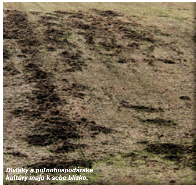
Diviaky a poľnohospodárske kultúry majú k sebe blízko.

Zdomácnovanie diviaka, ktoré sa začalo pravdepodobne v Malej Ázii, je úzko späté so vznikom poľnohospodárstva a s usídľovaním človeka. Dovtedajší tradičný nomádsky spôsob života prakticky neumožňoval brať so sebou prasce, ktoré boli oveľa menej pohyblivé ako ovce či kozy. No najväčšou prekážkou bola nepochybne nemožnosť uskladnenia mäsa, ktoré bolo na rozdiel od mäsa prežúvavcov príliš tučné, a preto ťažko konzervovateľné sušením, čo bola v tom čase jediná známa metóda. Bolo si treba počkať na prelomový objav používania soli ako konzervačného prostriedku, aby sa ľudstvo mohlo začať bližšie zaoberať skrotením diviaka. Podarilo sa to vlastne pomerne nedávno, len približne 4 až 5 tisíc rokov pred našim letopočtom, čo sčasti vysvetľuje, prečo je udomácnovanie diviaka ešte dnes takpovediac neúplné a nedokončené. Technika konzervovania soľou k nám prišla, tak ako mnoho iných vecí, z Číny. Dospelé ošípané majú s diviakmi spoločných ešte veľa génov a vlastností,