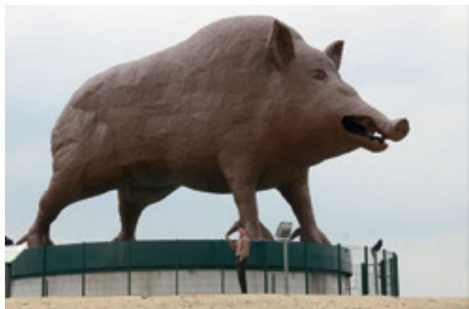
Symbol Arden majestátne tróni pri vstupe do departementu.

Ošipaná a diviak sa môžu páriť a ich potomstvo nie je „hybridné“, ale sú to „križence“ schopné ďalej sa reprodukovať.