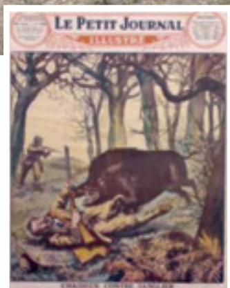
Diviak je synonymom sily, bezcítosti a chrabrosti.

ktorí ulovia a rozporciujú desiatky diviakov za sezónu: koľko kotliet nasekáte z jedného pekného kanca? Kto vie odpovedať?