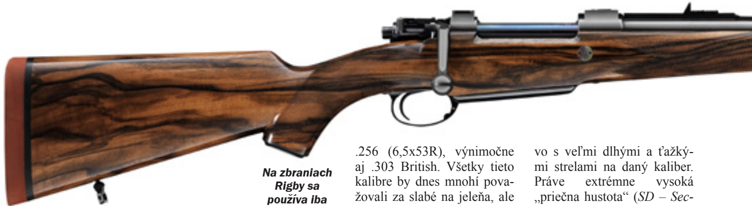
Na zbraniach Rigby sa používa iba výberové drevo.