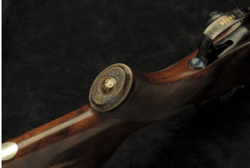
Každý detail je dotiahnutý do dokonalosti.