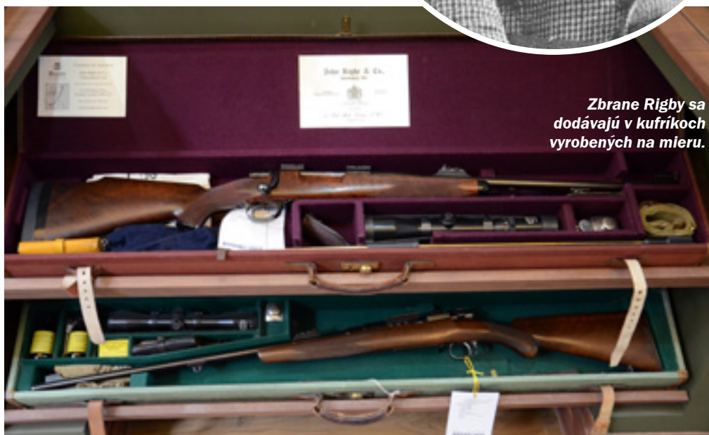
Zbrane Rigby sa dodávajú v kufríkoch vyrobených na mieru.